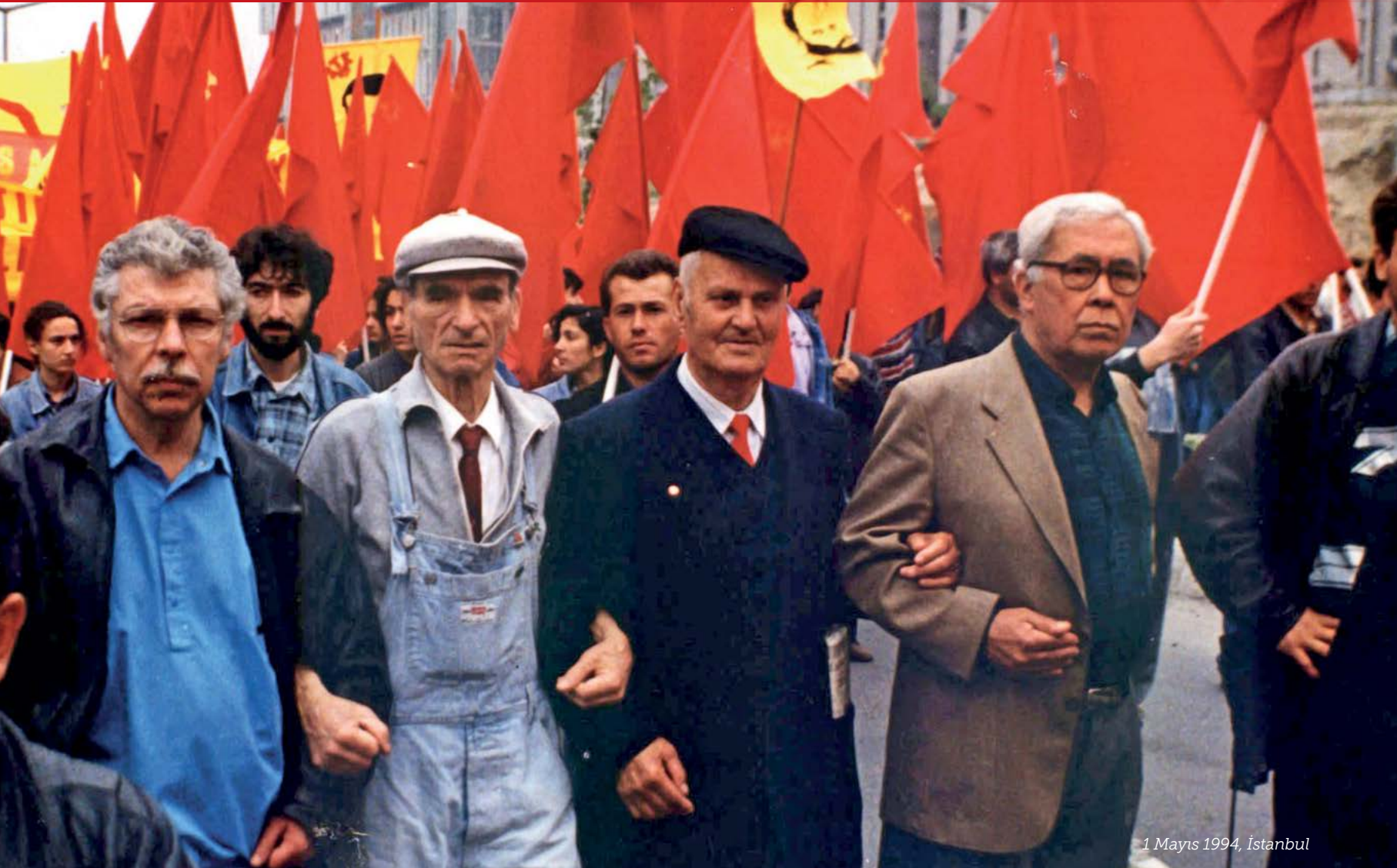
1 Mayıs 1994, İstanbul