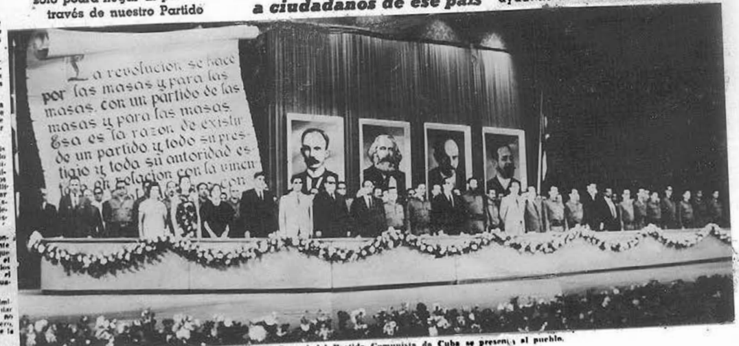
El Comité Central del Partido Comunista de Cuba se presenta al pueblo.

Nosotros no podemos decir jamás que sean cómplices de los imperialistas los que nos han ayudado a derrocar al imperialismo