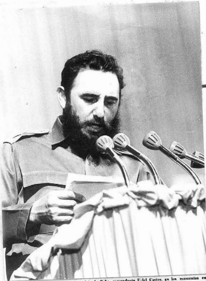
El Primer Secretario del Partido Comunista de Cuba, comandante Fidel Castro, en los momentos en que daba lectura a la carta del compañero Ernesto Che Guevara.

1.ª Habana, Lunes 4 de octubre de 1965. Precio 5 centavos. Año 1 / Número 1