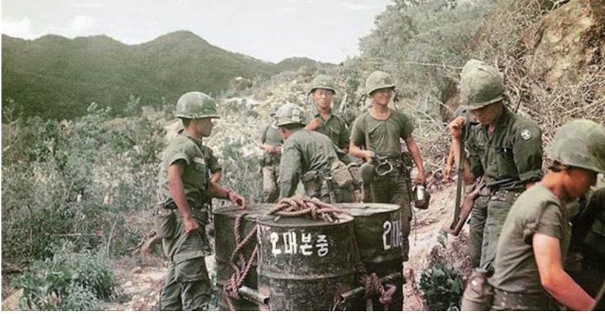
Güney Kore 9. Piyade Tugayına bağlı askerler Vietnam'da.