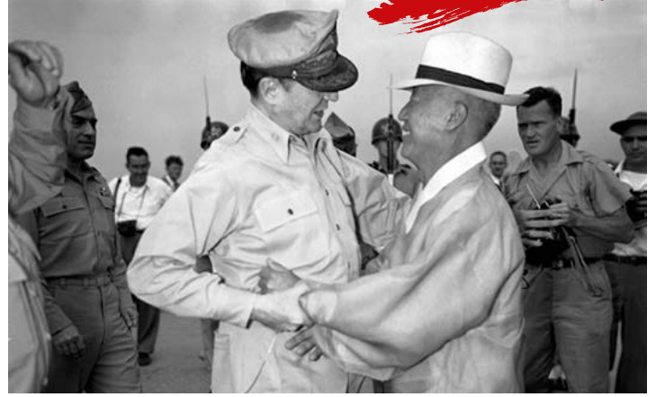
Güney Kore'nin ilk Cumhurbaşkanı Syngman Rhee ve ABD Generali MacArthur