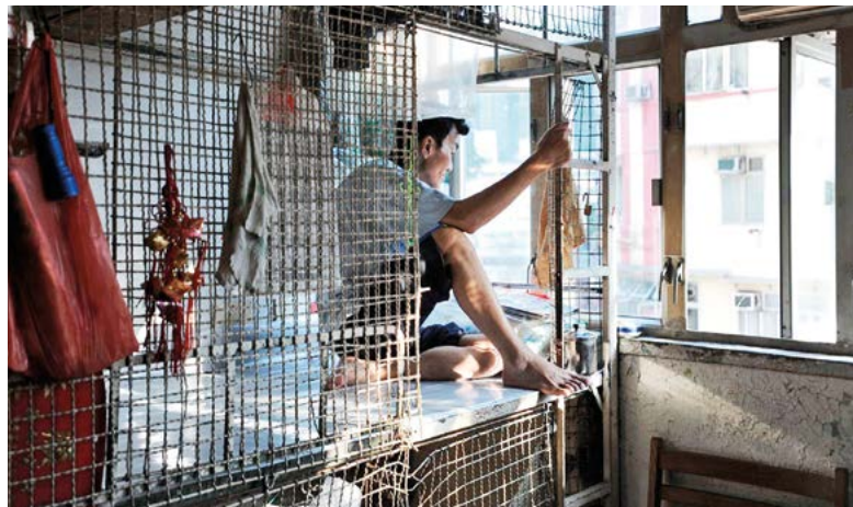
Devasa gökdelenleri ve zenginlikleriyle bilinen Hong Kong'da bir işçinin yaşamak durumunda kaldığı "kafesi"